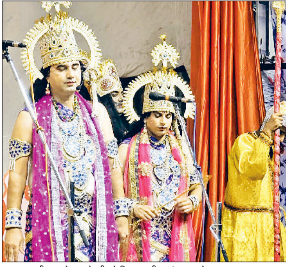
भूना। रामलीला महोत्सव के तीसरे दिन रामलीला मंचन करते कलाकार।