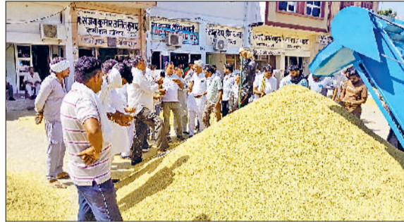
फतेहाबाद। जिले की मण्डियों में आया धान।

प्रदेश सरकार द्वारा परमल धान की सरकारी खरीद शुरू किए 4 दिन हो गए हैं। फतेहाबाद जिला में वीरवार को इक्का-दुक्का मंडियों में ही खरीद की गई। फतेहाबाद की मण्डी में आज शुक्रवार से धान की खरीद विधिवत रूप से शुरू हो जाएगी। आज पहले दिन डीएफएससी खरीद एजेंसी द्वारा परमल धान की खरीद की जाएगी। जिला फतेहाबाद में कुल 3 लाख 21 हजार 941 एकड़ में नान बासमती की फसल की बिजाई हुई है। 37393 एकड़ में बासमती धान लगा हुआ है। इनमें कुल 22518 किसानों ने मेरी फसल-मेरा ब्यूरा पोर्टल पर पंजीकरण करवाया है। जिले में कुल 7 अनाज मण्डियां व 43 खरीद केंद्रों पर परमल धान की खरीद की जाएगी। आज से इन किसानों के गेट पास कटने शुरू हो गए हैं। बिना गेट पास के किसान की फसल नहीं बिकेगी। इस बार राइस मिलर्स ने फैसला किया है कि भरी-खाली का खेल नहीं होगा।