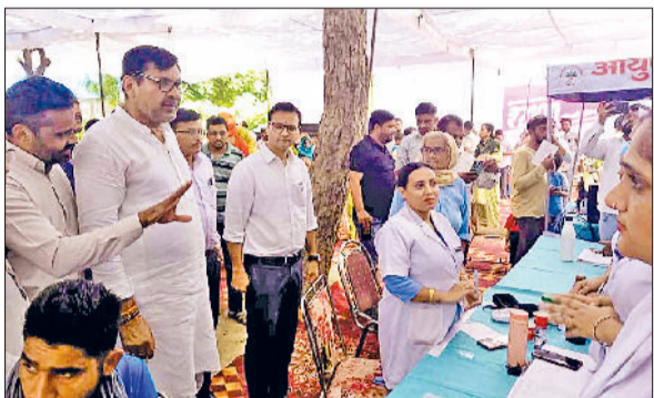
टोहाना। नागरिक अस्पताल में आयोजित कार्यक्रम में भाग लेते पूर्व मंत्री देवेन्द्र बबली।