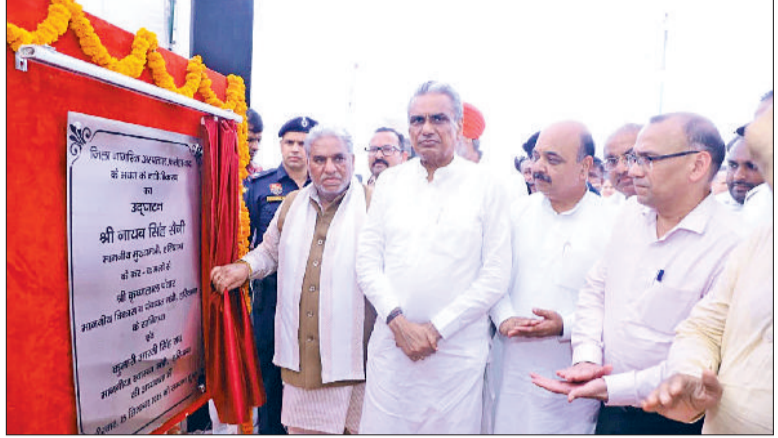
फतेहाबाद। जिला नागरिक अस्पताल के भवन के नवीनीकरण कार्य का उद्घाटन करते कैबिनेट मंत्री कृष्ण लाल पंवार।

हरिभूमि न्यूज फतेहाबाद हरियाणा की महिलाओं के आर्थिक सशक्तिकरण की दिशा में एक ऐतिहासिक कदम उठाते हुए मुख्यमंत्री नायब सिंह सैनी ने वीरवार को पंचकूला से महत्वाकांक्षी लाडो लक्ष्मी योजना का शुभारंभ किया। इस अवसर पर जिला फतेहाबाद में तीनों विधानसभा क्षेत्रों फतेहाबाद, टोहाना व रतिया में भी कार्यक्रम का सीधा प्रसारण किया गया। मुख्यमंत्री नायब सिंह सैनी ने फतेहाबाद में आयोजित कार्यक्रम में प्रदेश के विकास एवं पंचायत मंत्री कृष्ण लाल पंवार मुख्य अतिथि के रूप में मौजूद रहे। कार्यक्रम में कैबिनेट मंत्री ने लगभग 7 करोड़ रुपये की राशि से नागरिक अस्पताल के नवीनीकरण कार्य का भी उद्घाटन किया। रतिया में आयोजित कार्यक्रम में पूर्व सांसद सुनीता दुग्गल और टोहाना में आयोजित कार्यक्रम में पूर्व मंत्री देवेन्द्र बबली ने शिरकत की।