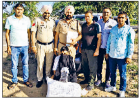
फतेहाबाद। भारी मात्रा में गांजा सहित गिरफ्तार युवक।

फतेहाबाद पुलिस द्वारा नशा तस्करों के खिलाफ चलाए जा रहे विशेष अभियान को एक और सफलता मिली है। सीआईए स्टाफ फतेहाबाद पुलिस की बड़ी कामयाबी आधार पर कर्मशियल मात्रा में गांजा, एक 32 बोर की अवैध पिस्तौल, दो जिंदा कारतूस तथा तस्करों में प्रयुक्त कार के साथ एक