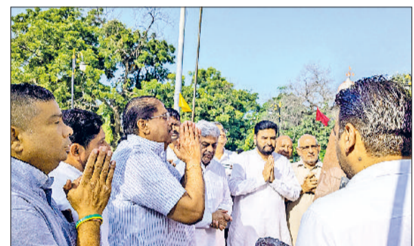
सिरसा। चौ. देवीलाल की प्रतिमा पर पुष्प अर्पित करते अजय चौटाला व अन्य पार्टी प्रदाधिकारी।

जननायक जनता पार्टी के राष्ट्रीय अध्यक्ष डॉ. अजय सिंह चौटाला ने कहा कि पूर्व उपप्रधानमंत्री चौधरी देवीलाल एक व्यक्ति न होकर संस्था थे जिन्होंने मूल्य और आदर्श लिए जाते हैं। अजय चौटाला गुरुवार को चौधरी देवीलाल की जयंती पर सिरसा में आयोजित कार्यक्रम को संबोधित कर रहे थे। उन्होंने कहा कि चौधरी देवीलाल ने न केवल किसी विशेष वर्ग को बल्कि समाज के सभी वर्गों को लाभान्वित करने के लिए कार्य किए। इसमें सर्वप्रमुख बुजुर्गों के लिए सामाजिक सम्मान पेशान लागू कर देश में एक नई पहल की जिसे आज देश के सभी राज्य अपना रहे हैं। उन्होंने कहा कि