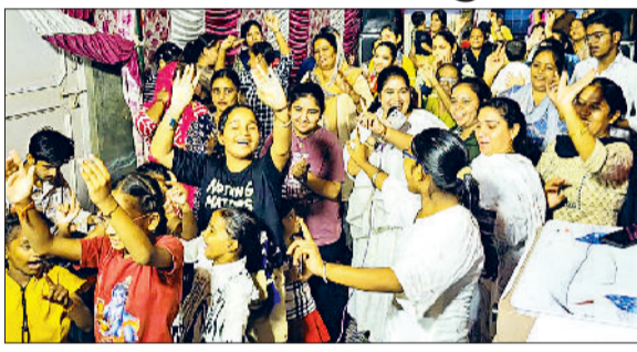
फतेहाबाद। दुर्गा महोत्सव में भजनों पर नाचते श्रद्धालु।