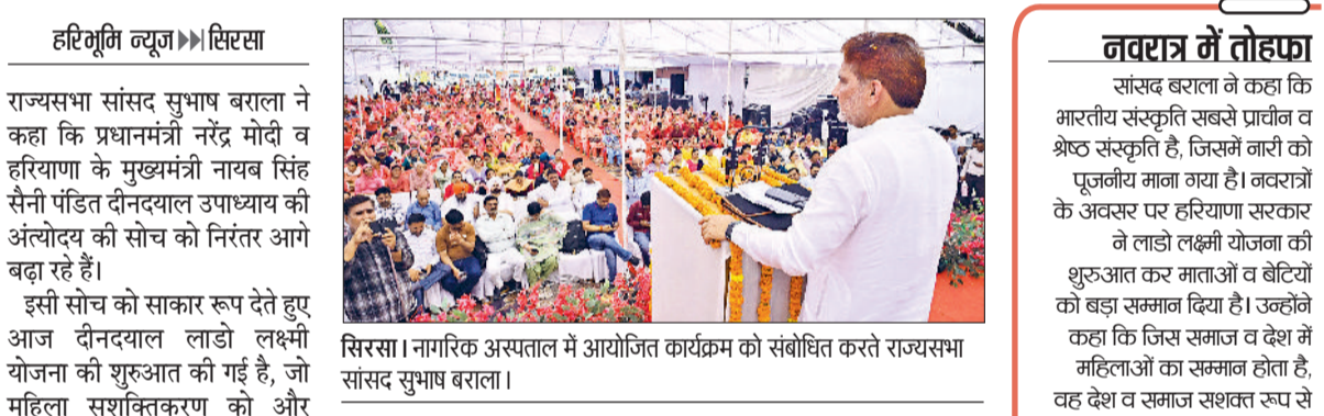
हरिभूमि न्यूज सिरसा राज्यसभा सांसद सुभाष बराला ने कहा कि प्रधानमंत्री नरेंद्र मोदी व हरियाणा के मुख्यमंत्री नायब सिंह सैनी पंडित दीनदयाल उपाध्याय की अंत्योदय की सोच को निरंतर आगे बढ़ा रहे हैं। इसी सोच को साकार रूप देते हुए आज दीनदयाल लाडो लक्ष्मी योजना की शुरुआत की गई है, जो महिला सशक्तिकरण को और मजबूत करने का काम करेगी। सुभाष बराला गुजरात को सिरसा के नागरिक अस्पताल में दीनदयाल लाडो लक्ष्मी योजना का शुभारंभ किया। नागरिक अस्पताल में आयोजित जिला स्तरीय कार्यक्रम को संबोधित कर रहे थे।

मुख्यमंत्री नायब सिंह सैनी ने पंचकूला में आयोजित राज्य स्तरीय कार्यक्रम में दीनदयाल लाडो लक्ष्मी योजना का शुभारंभ किया। नागरिक अस्पताल में आयोजित जिला स्तरीय कार्यक्रम में इस राज्य स्तरीय कार्यक्रम का लाइव प्रसारण भी दिखाया गया। कार्यक्रम के दौरान आयुष्मान योजना के लाभार्थियों को कार्ड भी वितरित किए गए। इसके अलावा उपमंडल स्तर पर भी कार्यक्रमों का आयोजन किया गया।