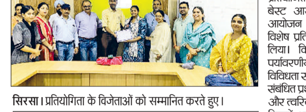
सिरसा। प्रतियोगिता के विजेताओं को सम्मानित करते हुए।

सिरसा। इंटर कॉलेज प्रतियोगिता के विजेताओं को सम्मानित करते हुए।